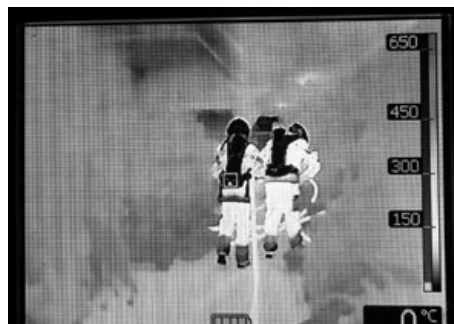
Sichtfeld der Wärmebildkamera

Die Hauptaufgabe lag bei der Maschinenhalle. Mit einer Löschleitung erkundete ein Trupp die verrauchte Halle und stiess dabei auf eine bewusstlose Person. Diese wurde an die definierte Patientensammelstelle gebracht. Im weiteren Verlauf spielte ein Angehöriger der Feuerwehr einen Schwächeanfall während des Atemschutzeinsatzes vor. Die anwesenden Kameraden reagierten korrekt und brachten auch diese Person rasch in Sicherheit.