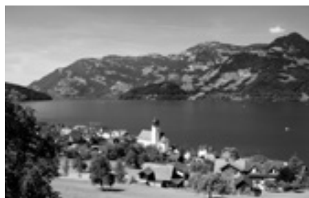
Sicht auf Beckenried

Unsere diesjährige Reise führt uns in den Kanton Nidwalden. Auf weniger bekannten Strassen fahren wir entlang der Albiskette zum Kaffeehalt nach Feusisberg zum Landgasthof Ried. Für das Mittagessen fahren wir weiter nach Beckenried zum Hotel Seerausch.