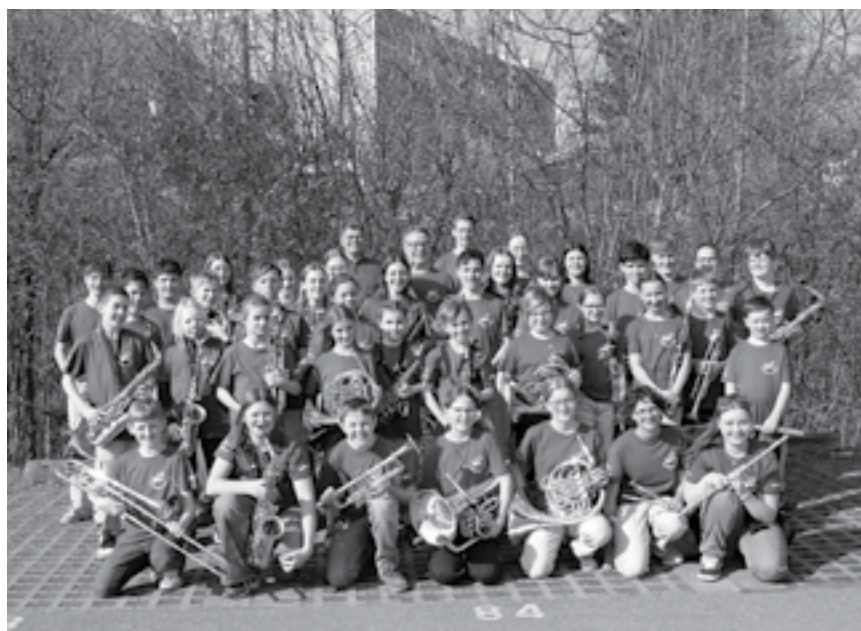
Die Windband 2026 mit rund 40 Jugendlichen zwischen 8 und 17 Jahren.