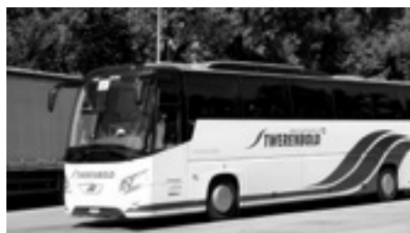
Unterwegs mit Twerenbold

Parkplätze für maximal 30 Privatfahrzeuge gibt es beim Schützenhaus Dielsdorf (Kiesplatz). Wir sind wieder mit der Firma Twerenbold unterwegs.