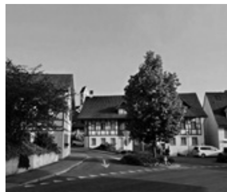
Aufnahmen von Dielsdorf