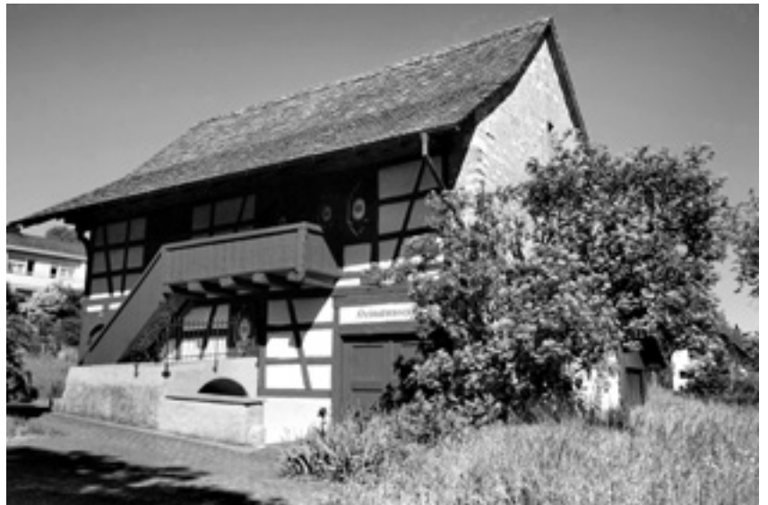
Das Heimatmuseum in Oberweningen

Weitere Informationen auf der Webseite des Museumsvereins: www.zumv.ch