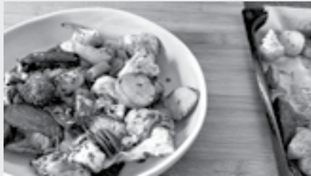
Ein Beispiel: Ofengemüse mit Quarkdip.

Allein kochen und essen kann die Freude am Essen hemmen und fördert die Einsamkeit. Gemeinsames Kochen inspiriert zu neuen Rezeptideen, führt zu genussvollem und gesundem Essen und lässt einen Teil der Gemeinschaft sein. Silber Tavolata bietet mit dem Projekt «Virtuelle Silber Tavolata» Onlinekochkurse für die Zubereitung einer gesunden und ausgewogenen Ernährung 60+ an. Es besteht auch die Möglichkeit, sich zwischen den Kursen physisch zu treffen und auszutauschen. Bei grossem Interesse können zwischendurch auch physische Kochkurse durchgeführt werden. Die Kurse orientieren sich an den Schweizer Ernährungsempfehlungen für ältere Erwachsene sowie an der neuen Schweizer Ernährungspyramide.