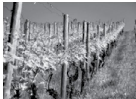
Weingut Weidmann in Regensburg