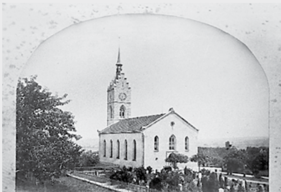
Ref. Kirche Dielsdorf vor 1955: aus der Bildersammlung «Ein Dorf verändert sein Gesicht».