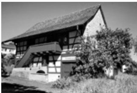
Das Heimatmuseum in Oberweningen

Weitere Informationen auf der Webseite des Museumsvereins: www.zumv.ch