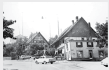
Aus der Bildersammlung: «Ein Dorf verändert sein Gesicht». Sonnen-Kreuzung vor 1974