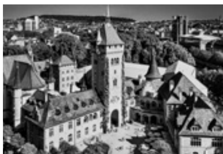
Das Schweizerische Landesmuseum in Zürich

Ausstellung «Wir und der Krieg» Donnerstag, 23. Juli 2026, 14.00 Uhr bis 15.30 Uhr